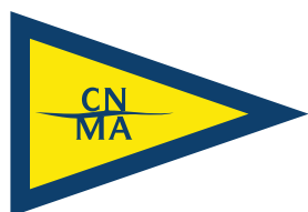
CIRCOLO NAUTICO MARINA GENOVA